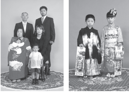
特設スタジオでの記念写真

土・日・祝日に限らず期間中には会館二階に特設写真スタジオを設け記念写真を撮っていただけるよう設備しています。