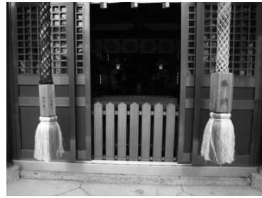
更新奉納された鈴緒網・麻房