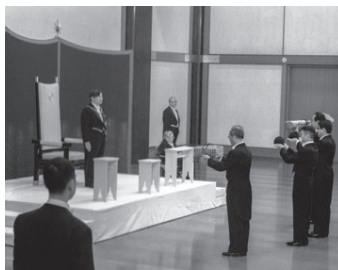
剣璽等承継の儀の様様