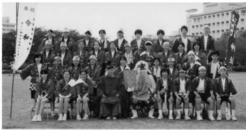
三石神社例大祭 神幸式記念 令和元年5月26日