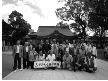
方違神社前での記念写真