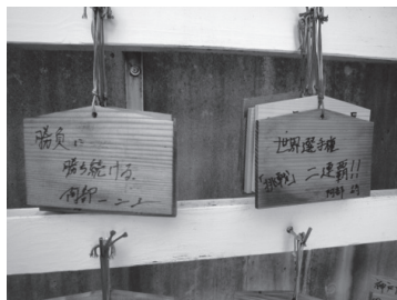
阿部兄妹の祈願絵馬

本年八月に東京で開催された世界柔道選手権での結果は、阿部詩選手は祈願絵馬に書いた通り見事二連覇の優勝を成し遂げたが、一二三選手は三位であつた。