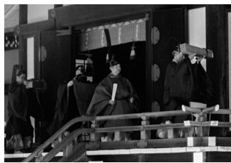
賢所参拝を終えられた両陛下