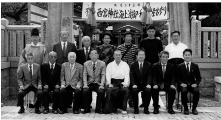
西宮神社和田岬海上渡御産宮参り（中止）参拝 令和元年9月23日 三石神社