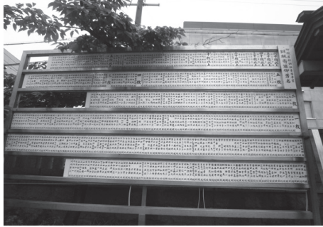
境内の奉賛芳名掲示板