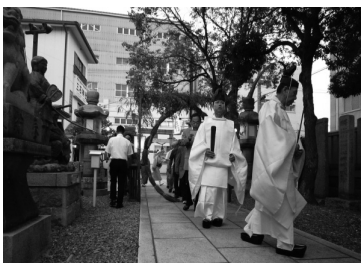
茅の輪くぐり神事