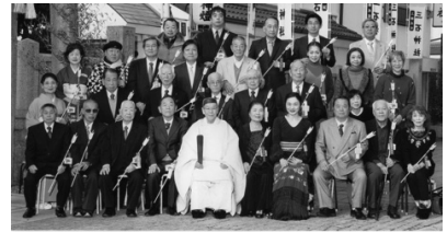
三石神社 氏子崇敬者 繁栄祈願祭 平成31年1月3日