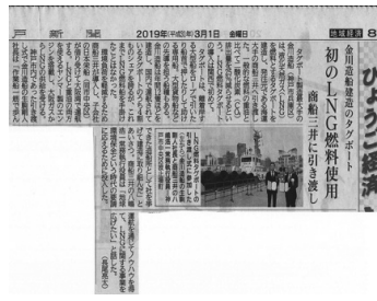
報道された新聞記事

更に(株)三井商船はLNG燃料タグ ボート「いしん」の金川造船(株)で 建造から竣工引渡式までの様子をま とめた動画編集編をYouTube で公開している。