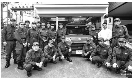
入魂修祓式後の記念写真

十五日午前九時、兵庫区御崎町二丁目の兵庫消防団第六分団詰所に於いて、消防自動車（軽四）の入魂修祓式が齋行された。