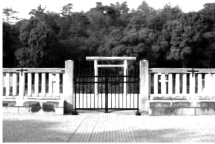
奈良市の神功皇后御陵

本年は宮司夫妻で参拝したが、新型コロナウイルス感染の事もあって、毎年多人数で参拝している大阪・住吉大社も宮司外一名の参拝で、神酒拝戴も省略した祭典であった。