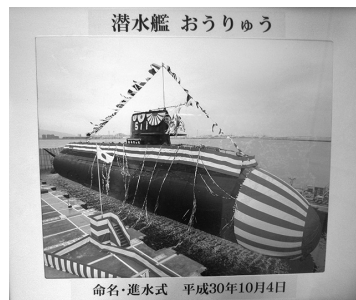
乗組員より寄贈された進水式写真

三菱神戸造船所で建造中の潜水艦「おうりゅう」の三月五日の引き渡しに先立つ、二月十三日、神棚(三石神社神札奉安)入魂修祓式を齋行した。