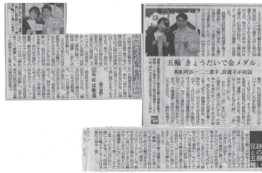
神戸新聞、スポーツ新聞記事など

をはじめ多くの報道陣も詰め掛け、境内のいたるところで二人の新春インタビューと当社の勝運御守・祈願絵馬などを持った写真撮影などが約一時間半にわたり執り行われた。