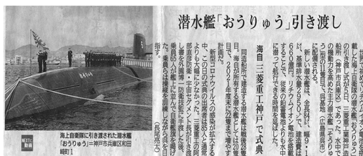
報道された新聞記事

チウムイオン電池を搭載したことにより、従来の潜水艦よりも水中に潜って航行できる時間を延ばした。三月の引き渡し後、操縦訓練しながら