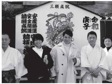
大絵馬の前で勝運御守を持つ阿倍兄妹との参拝記念写真

初詣で賑わう二日、御祭神・神功皇后の勝運神徳の御守護を賜り、本年開催される東京オリンピックの柔道女子五十二キロ級金メダル候補として注目される阿部詩選手、兄で六十六キロ級の一二三（共に日体大）選手が今年も必勝祈願参拝した。