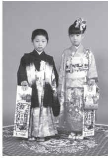
特設スタジオでの記念写真