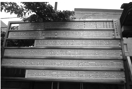
境内の奉賛芳名掲示板