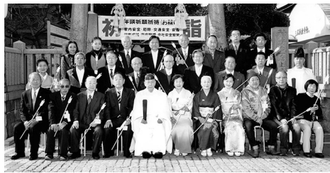
鳥居前での記念写真

先生の点てられたお抹茶はご神前に供えられ、ご祭神も初めてのお抹茶を満喫されたことであろう。