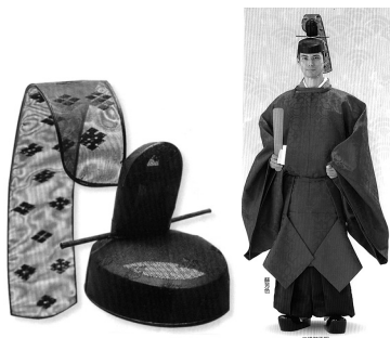
二級以上の冠と装束

神職には身分制度の他に階位制度もあり、それによる祭祀服装に規定があつて、二級神職は正装（正服）のうち、冠・袍・袴などが替り、冠は遠紋（無紋）から繁紋（紋入）に、袍は緑無地（青色）から蘇芳色（緋色）に、また袴の色は浅黄（水色）から紫袴を着装することが許される。