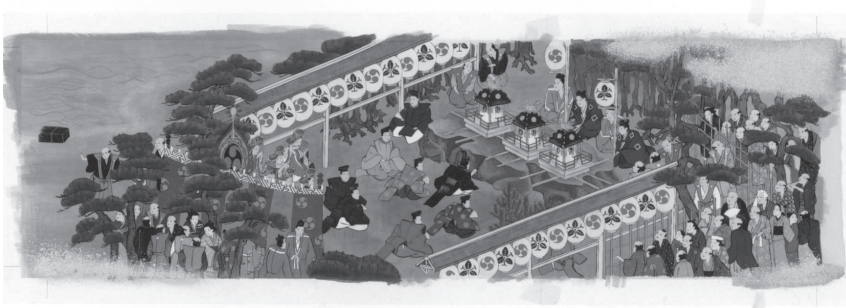
復元された『西宮大神本紀』の「和田岬御旅所（三つ石）神事」の図 （記事は九月の項に掲載）