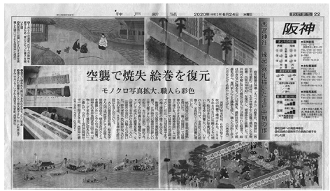
復元された「西宮大神本紀」の報道記事

そもそも二十年前から斎行された西宮神社の和田岬への船渡御は、平安時代から行われていたが、織田信長の社領没収で途絶えていたものを