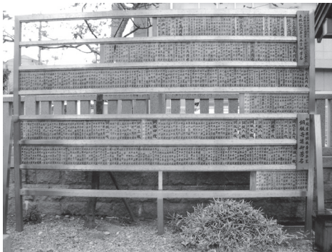
境内の奉賛芳名掲示板