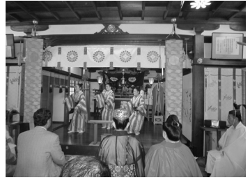
神前奉納の琉球舞踊

共に義援 金募集も 呼びかけ た。物産 展は大盛 況で、す べて完売 し、義援 金も多く 寄せられ た。