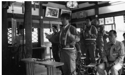
玉串拝礼する代表者

三菱神戸 造船所原 子力工作 部格納器 工作課員 を始め、 施工社で ある近畿 菱重興産 工事関係