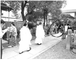
茅の輪くぐり神事

日で近隣会 社関係者の 欠席もあつ て、総代・ 氏子崇敬者 二十二名の 参列であつ