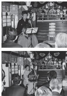
ご神前での琵琶演奏奉納

正月三日、第二十九回目となる「氏子崇敬者繁栄祈願祭」が総代・氏子崇敬者三十九名の参列のもと厳かに齋行され、今年一年の各位の安寧と