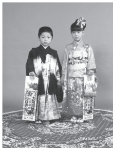
特設スタジオでの記念写真

期間中の土・日・祝日には会館二階に特設写真スタジオを設け、記念写真を撮っていただけるよう設備しています。