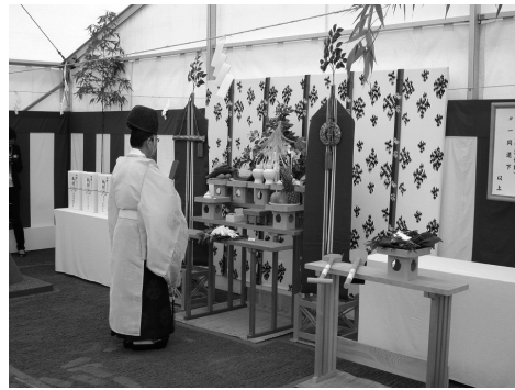
二一七棟新築起工地鎮祭

の無事故・無災害を祈願した。 尚、神酒拝戴しての祭典後には、 建築主・設計施工共同企業体の各代 表者の挨拶も行われた。