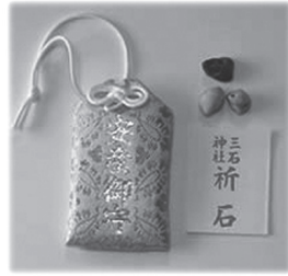
腹帯と三つの石の入ったお守り