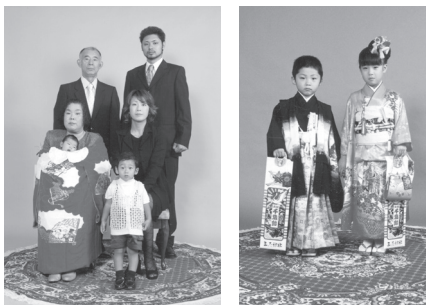
特設スタジオでの記念写真