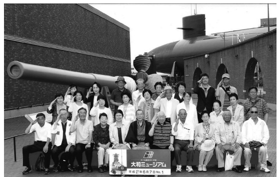
大和ミュージアム前での記念写真

氏子会七名・東部氏子会四名・猿田彦会二名・崇敬者一名）の参加のもと広島県呉市の大和ミュージアム・海上自衛隊呉資料館（てつのくじら館）等を見学する日帰りバス旅行を実施した。