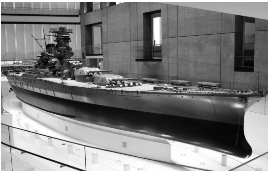
大和ミュージアム展示の十分の一の戦艦大和