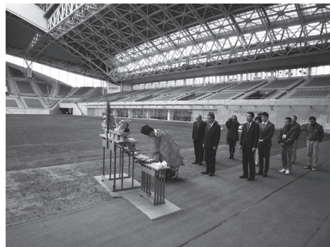
スタジアム内での神事

十四日、ノエビアスタジアムである神戸ウイングスタジアム(株)の芝ピッチの張替工事竣工祝安全繁栄祈願祭が齋行された。