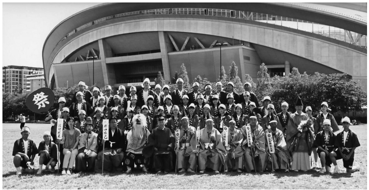
スタジアム前での記念写真

地区お旅所の入魂修祓式を齋行し、午後一時半より、地区総代・氏子役員・自治会関係者の指導により、子供みこし四基が神輿唄を声高らかに唄いながら氏子町内を巡幸した。本年より和田岬小学校PTAのご協力により生徒各位に子供みこし参加募集用紙を配布した。その効果宜しく例年より子供の参加が多く見られた。