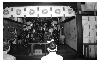
神前奉納の琉球舞踊