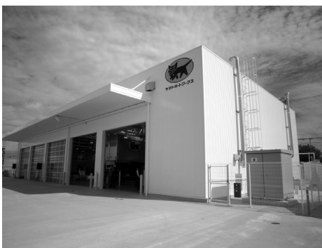
竣工した新自動車整備神戸工場