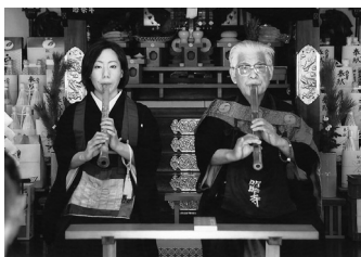
尺八奏奉納の神前で

まず白毫先 生によつて 中国・唐の 高僧普化禅 師の振鐸を 尺八の名 人・張伯居 士が普化振 鐸として作 曲し、日本 に伝わった 唯一の尺八 古典本曲で ある「嘘 鈴」の献奏 があり、続 いて白毫・