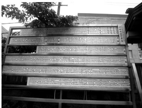
プラ板に書き換えられた社殿銅板奉納者掲示板

当社殿の銅板枚数は約七千枚が必 要とのこと。そこで平成十四年十月 より「社殿屋根吹替え用銅板奉納事 業」として、氏子崇敬者の方々から 広く銅板奉納（一枚、二千円）を開 始した。銅板を奉納して頂いた方々 の氏名・会社名等を木製の板に記し て境内の掲示板に順次掲げておりま したが、風雨による年月の経過に依 り奉納者名が判読できなくなつた ため、この度プラスチック板に書き換 え、多くの参拝で賑わう五月例大祭 前の四月二十四日に現在既に銅板奉 納を頂いた全ての方々の氏名を新た に掲示させていただいた。銅板奉納