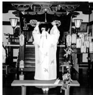
巫女による「剣の舞」奉納

ナウイルスを断ち切るという祈願も込め、巫女が刀を持って舞う「剣の舞」を奉納し厳肅に斎行した。 祭典後の直会は、時節柄、参列者各位に弁当などを渡し直会にかえた。