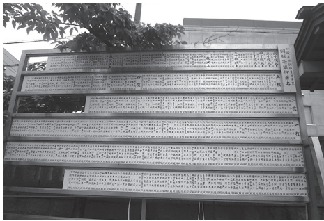
境内の奉賛芳名掲示板