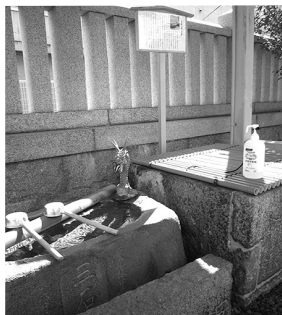
手水鉢奥に設置した説明高札