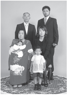
特設スタジオでの記念写真

当社では七五三に当たる子供さんの玉串奉奠や、拝殿内での記念写真撮影も行い、千歳飴やおモチャ・風船・おみやげセット等の他にキャラクターターバック等の記念品もお渡しし