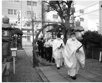
夏越祭（夏祭り）齋行