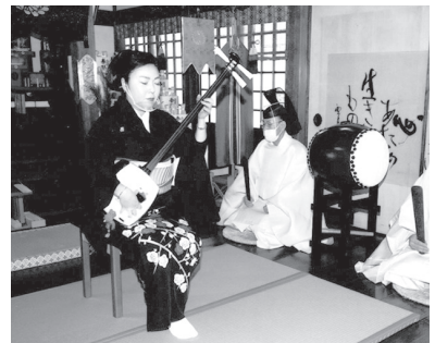
ご神前での津軽三味線演奏

祭」が総代・氏子崇敬者二十一名の参列のもと厳かに齋行され(新型コロナウイルス感染症の関係で参列は例年より少なかった)、今年一年の参列者各位はもとより、氏子崇敬者更