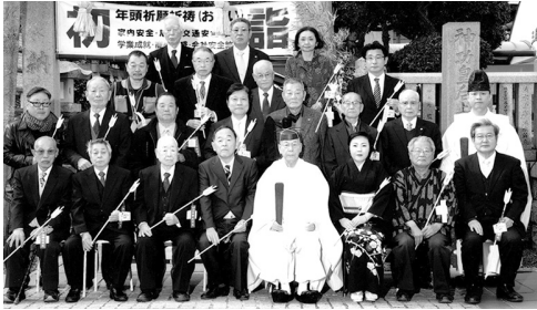
鳥居前での記念写真

んから節」は、貧困や凶作の世は去れを奏したもので、新型コロナウイルス感染症の世は去れにつながり、時局の曲である。 コロナ感染防止のため、フェイスマスクをつけられてはいるが、先生のバチを叩きつけるように弾き、テンポも速い演奏に、参列者も聞き入りご満悦の様子であった。 式典後、参列者一同破魔矢を持ち、鳥居前にて記念写真を撮ったが、時節柄各位に弁当等を渡し直会にかえた。