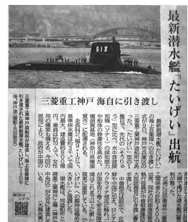
引き渡し新聞記事

新型コロナウイルス感染症が終息していない状況ではあったが、二十日(二十二日齋行の例大祭のうち、土・日曜日の子供みこし巡幸、神幸式は中止としたが、例祭は通常通り二十日(金曜日)午後六時に、助勤神主一名の奉仕により、総代始め氏子崇敬者十九名の参列のもと(新型コロナウイルス感染関係により例年より参列少なし)、「新型コロナウイルス感染を始めた諸々の病い気も無く」と祝詞奏上した後、巫女による神楽は本年もコロナウイルスを断ち切るという祈願も込め、刀を持って舞う「剣の舞」を奉納し厳粛に齋行した。 祭典後の直会は、時節柄、参列者各位に弁当などを渡し直会にかえ