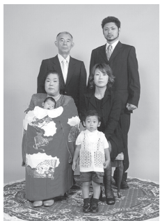
特設スタジオでの記念写真