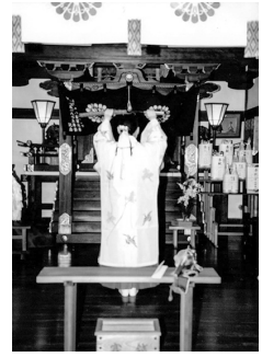
巫女による「剣の舞」奉納