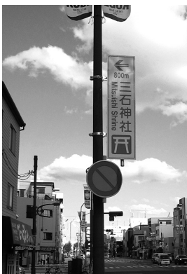
小松通三丁目交差点の神社案内道路標識

設置箇所は、県道西出高松前池線の小松通三丁目交差点（東西二カ所）、住吉橋線の住吉橋南詰御崎本町交差点（南北二カ所）等である。