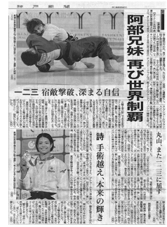
世界柔道選手権優勝 新聞記事