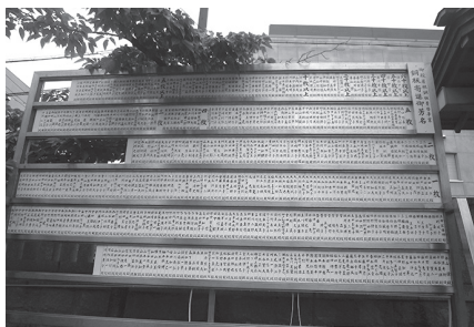
境内の奉賛芳名掲示板

順不同・敬称略 銅板奉納者全ての方々のご芳名は、神社台帳に記録の上永く保存させていただきますが、境内掲示板のご芳名掲示は三枚以上とさせていただきます。