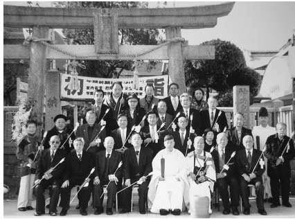
鳥居前での記念写真

式典後、参列者一同破魔矢を持ち、鳥居前にて記念写真を撮ったが、時節柄各位に弁当を渡し直会にかえた。